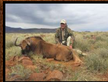
Black Wildebeest (hundyr)