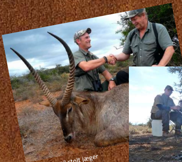
Tillykke til stolt jæger