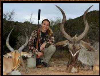
Impala (handyr) + Kudu (handyr)

Bemærk at reguleringsjagt (af hensyn til vildt forvaltningen), kun tilbydes på forespørgsel og i visse perioder af sæsonen.