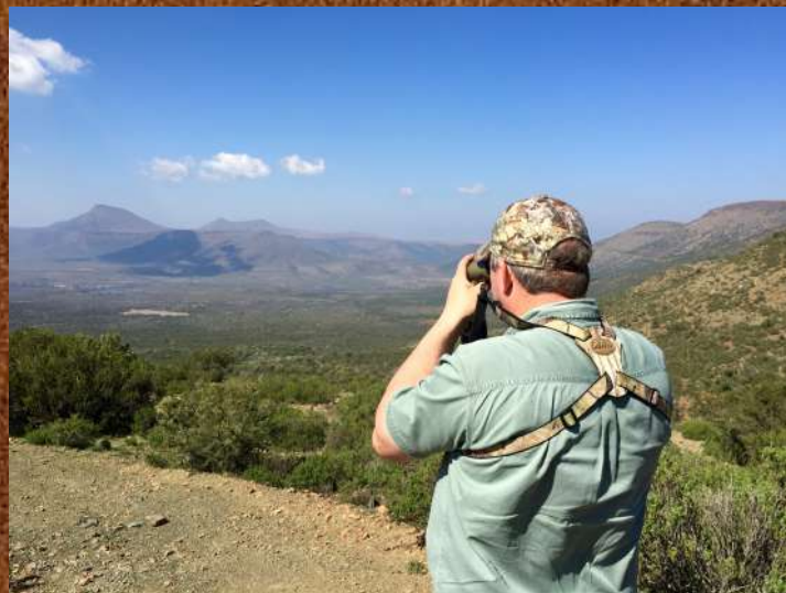
Vildtet spottes fra et højdepunkt, med efterfølgende pürsch

Bæredygtighed er naturligvis vigtigt for os og vi tilbyder derfor både trofæ og reguleringsjagt. Trofæjagten foregår på de gamle handyr og grundet vildtets optimale levevilkår og en stram afskydningspolitik, vil du opleve meget stærke trofæer, som i langt de fleste tilfælde ligger i medaljeklassen.