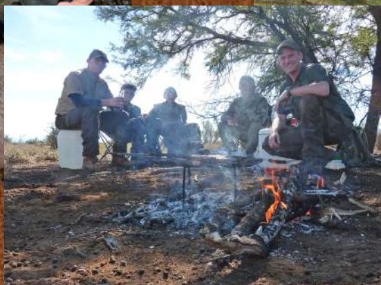
Frokost i jagt terrænet